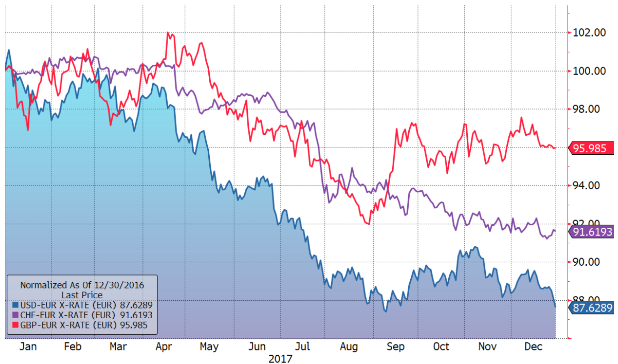
Chart USD, CHF, GBP, jeweils gegen EUR / Entwicklung 2017

Im Verhältnis EUR/USD wurde das Jahreshoch und zugleich der höchste Stand seit Januar 2015 im September mit einem Kurs von 1,2092 Dollar erreicht. Für diese Entwicklung können diverse Gründe angeführt werden: Die schlechte Bilanz des neuen amerikanischen Präsidenten, der mit seiner Regierung wenige seiner angekündigten wirtschaftlich relevanten Projekte durchsetzen konnte, führte zu einer Schwächung des Dollar, während der europafreundliche Wahlausgang in Frankreich und die gute konjunkturelle Entwicklung in der Eurozone, allen voran in Deutschland, den Wert des Euro stärkten.