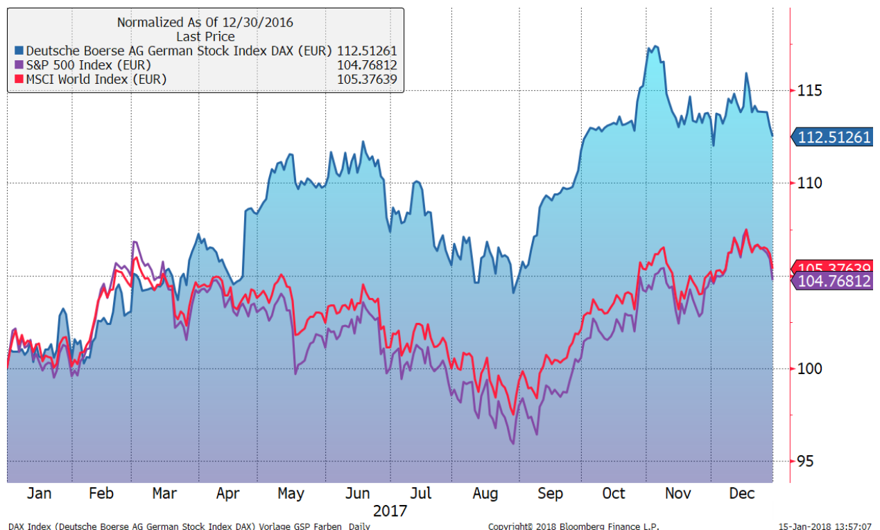
Chart DAX, S&P 500 und MSCI World / Entwicklung 2017 / in EUR

Für den amerikanischen Aktienmarkt galt im Jahr 2017 das gleiche Bewertungsphänomen. Der S&P 500 ist der größte der wichtigen US-amerikanischen Aktienindizes. Er schloss nahe seines All-Time-High mit 2.786 Punkten und wies eine Performance von 19,4% aus. Durch den schwachen USD wurde diese jedoch durch den Wechselkurs für Euroanleger auf 4,8% gedrückt. Der seit fast neun Jahren anhaltende